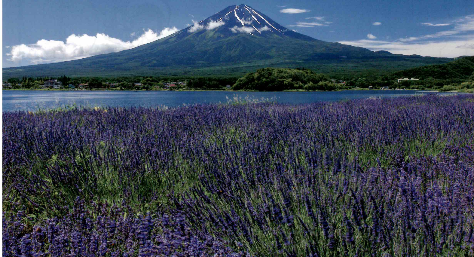
写真 / 大石公園から ※写真はイメージです。