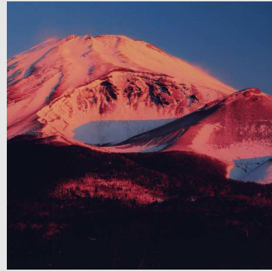
富士山と宝永河口