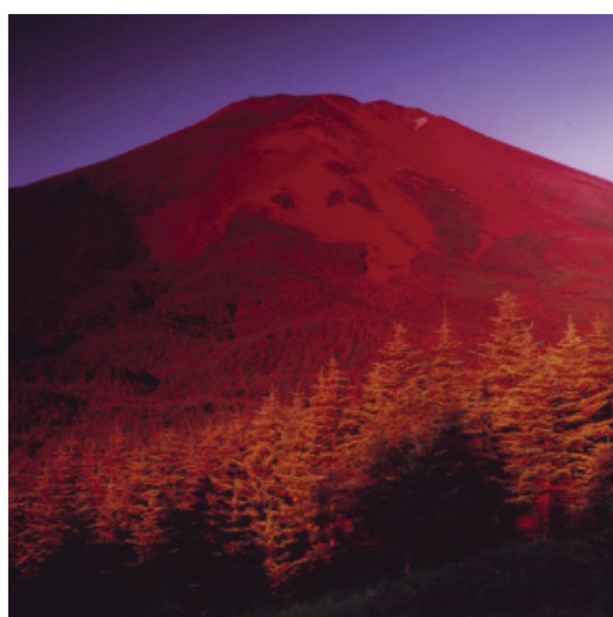
(滝沢林道からの富士)