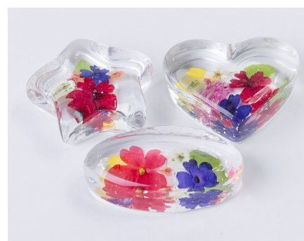
ペーパーウエイト